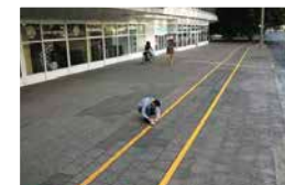
Brad Downey, Broken Bike Lane, Berlijn 2009