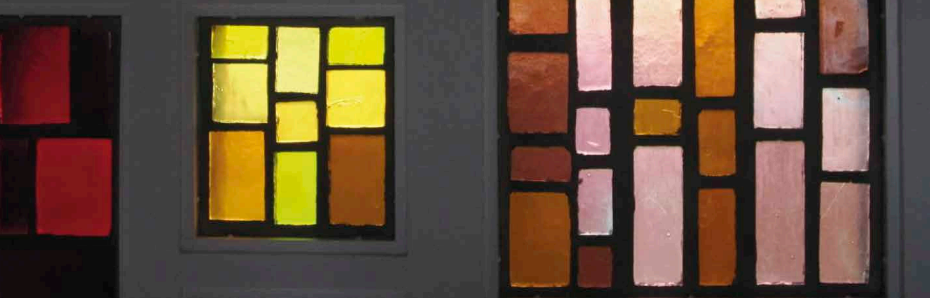
Glas-in-beton, Stationsplein 107

college dat vond dat de waardigheid van de stad een fraai en kostbaar interieur nodig heeft. Nu durft geen hond dat meer te zeggen. Alles moet nu vooral functioneel zijn. Politici willen vooral niks gek. Dat zie je ook aan het huidige Stadskantoor. Dat gebouw is utilitair en autonoom. Het wordt gehuurd door de gemeente. Het vertelt geen verhaal meer.