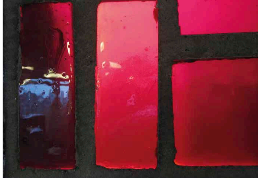
Glas-in-beton, Stationsplein 107

Verfraaiing van de architectuur zie je in die periode ook in scholen. Tenminste, in de scholen voor de betere stand. Een voorbeeld daarvan is de meisjes-HBS aan de Garenmarkt. Die is rijk uitgevoerd. Een groot verschil met de sobere school aan het