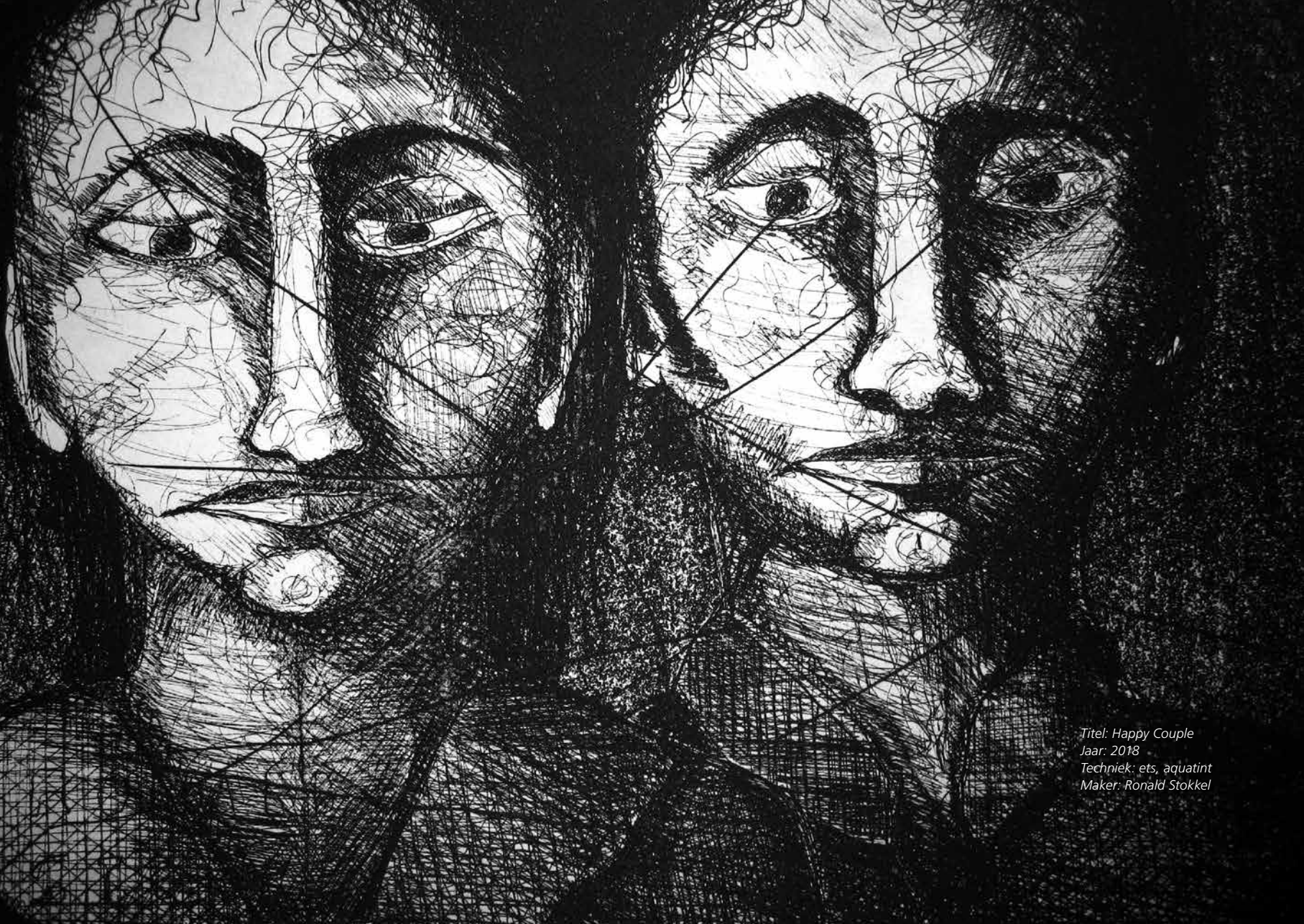
Titel: Happy Couple Jaar: 2018 Techniek: ets, aquatint Maker: Ronald Stokkel