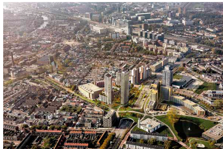
Impressie: RED Company