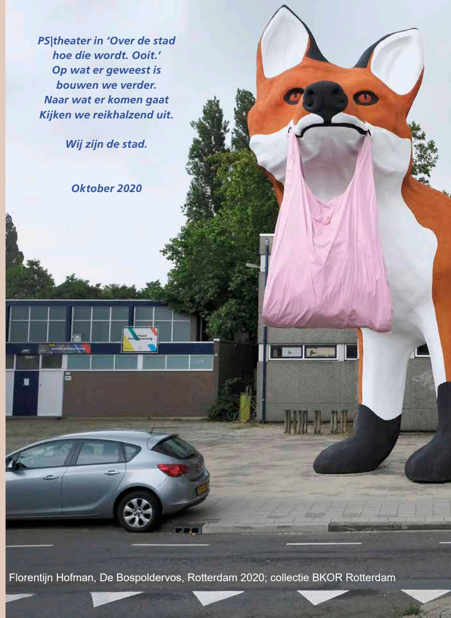
Florentijn Hofman, De Bospoldervos , Rotterdam 2020; collectie BKOR Rotterdam